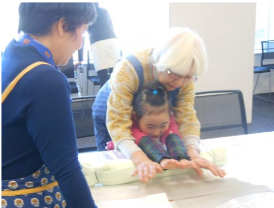
冬期ワークショップ