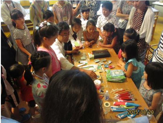
夏期ワークショップ